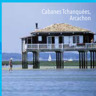
Cabanes Tchanquées, Arcachon