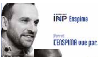
Témoignage du directeur