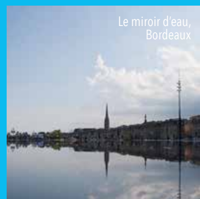
Le miroir d'eau, Bordeaux