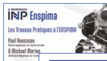
Témoignage d'un étudiant et d'un intervenant militaire