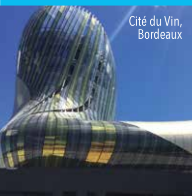
Cité du Vin, Bordeaux