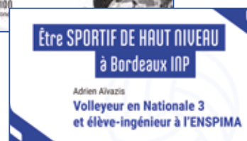
Témoignage d'un sportif de haut niveau

Cti La formation de l'ENSPIMA est habilitée par la CTI (Commission des Titres d'Ingénieur).