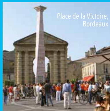
Place de la Victoire, Bordeaux