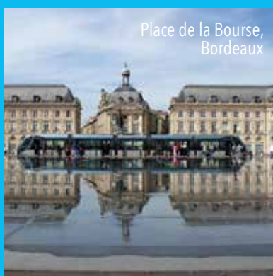
Place de la Bourse, Bordeaux