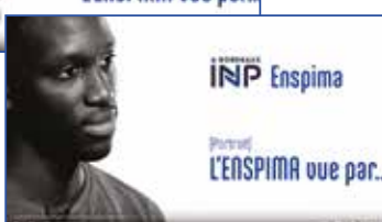
Témoignage d'un étudiant